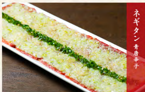
ネギタン 青唐辛子