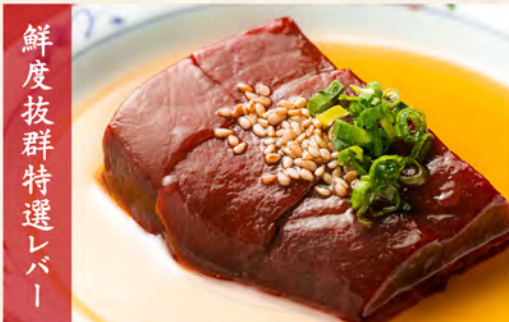
鮮度抜群特選レバー