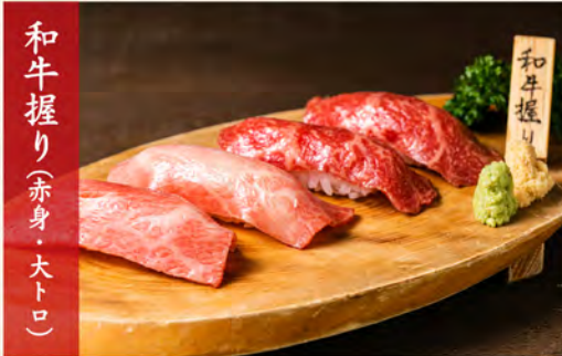
和牛握り(赤身・大トロ)