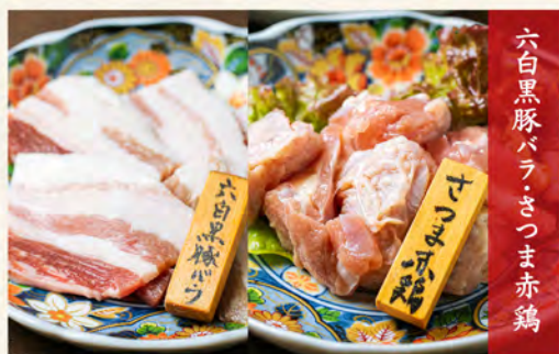
六白黒豚バラ・さつま赤鶏