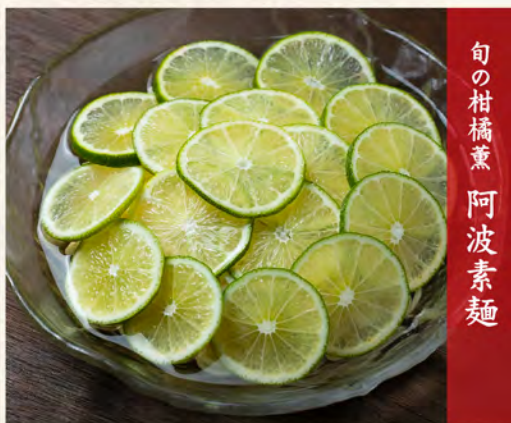
旬の柑橘薫阿波素麺

◎ 韓国冷麺 (通常) 950円 (一口サイズ) 450円 税込1,045円 税込495円