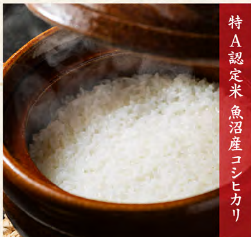
特A認定米魚沼産コシヒカリ