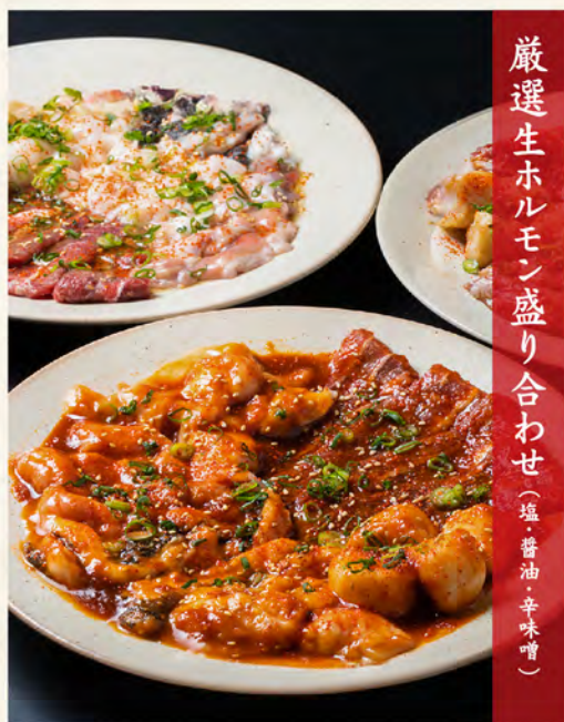
厳選生ホルモン盛り合わせ(塩・醤油・辛味噌)